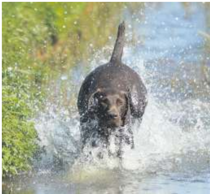
Bei der Wasserarbeit